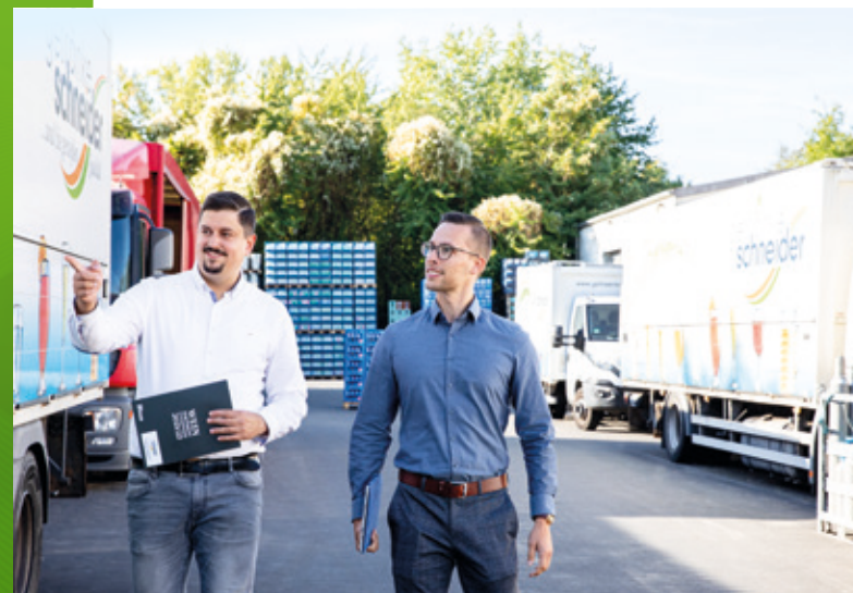
Qualitätssicherung ist wichtig! Unser Team hat die Wünsche der Kunden mit fachkundiger Kontrolle im Blick.